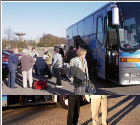
Ankomst om aftenen ca. kl. 18 ved Ellekærskolen efter en begivenhedsrig dag.