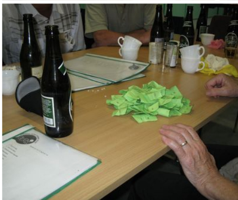
Og en klage -- selv med dette massive indkøb af lodsedler lykkedes det ikke bordet at vinde præmie