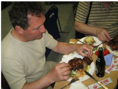
"Bones" i nærbillede