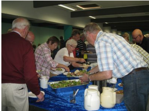
Der serveres lækre "bones" med tilbehør