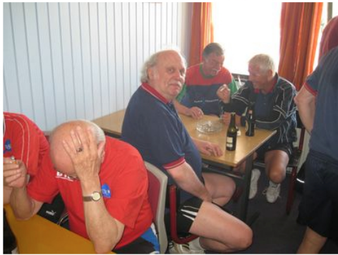
Og snakken går