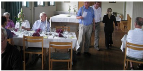
Formanden introducerer traktementet.