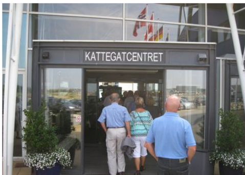
Ind og se hajer, men først--