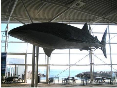
En spækhugger er hængt til tørre!