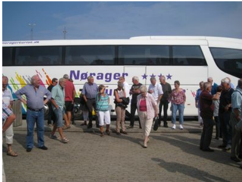
Next stop: Kattegatcentret.