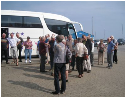
-- og afgang fra Kattegatcentret.