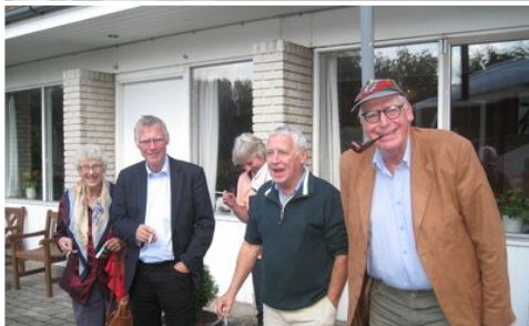
-- hvor der var tid til lidt nydelse inden det suveræne kaffe- og kagebord.