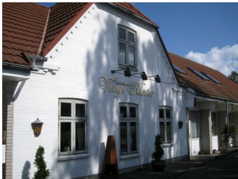
Efter dinner, afgang mod "Restaurant Venge Kloster"---