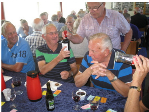
De heldige vindere.

(Jeg har set lykkens gudinde på film, og det var et noget anderledes billede).