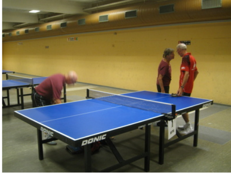
Taktikmøde inden finalen.