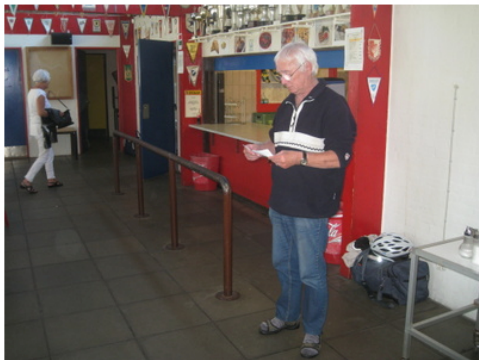
John som lykkens gudinde læser lodsedler op.

(Jeg har set lykkens gudinde på film, og det var et noget anderledes billede).