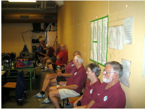
Tilskuere -- er der sensationer i luften?