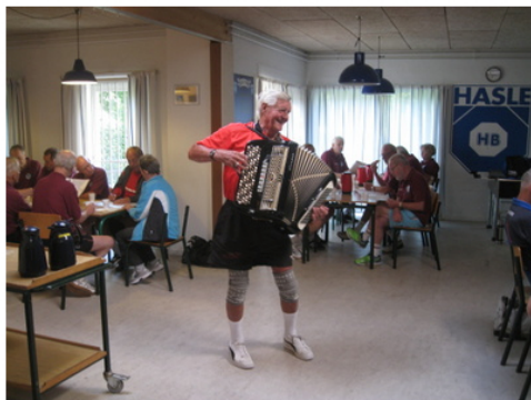
Orla starter dagen og morgenstunden med en munter sang fra Esbjerg -- "Det var på Fladenstrand jeg så hende komme, det var på --" osv.