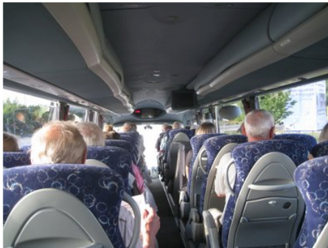
-- og vi kører i luksusbussen fra Nørager Turist mod vores 1. stop --