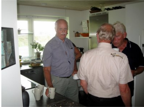
-- mens der smøres flere rundstykker i køkkenet.