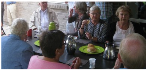
Morgenkaffe og rundstykker på terrassen.