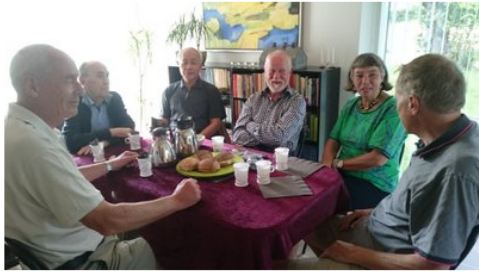
Morgenkaffe og rundstykker i de indre gemakker.