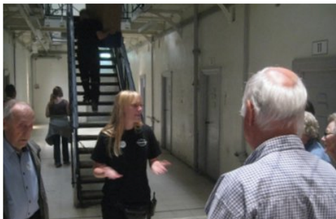
-- hvorefter vi blev modtaget af vores charmerende og fængslende guide.