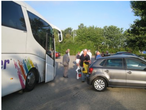
En årlig sommertur -- turen tager sin begyndelse!