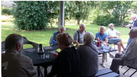
Morgenkaffe og rundstykker på terrassen.