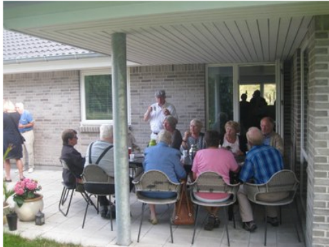
Vagns imponerende fritidshus i den lille by Løsning.