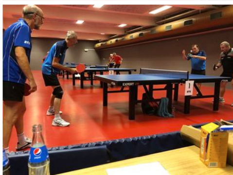
Glimt fra de spændende kampe.