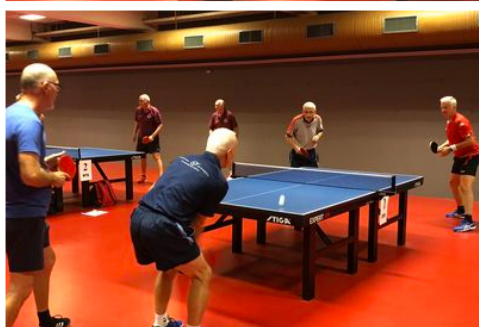
--- og glimt af en (måske) ulovlig serv.