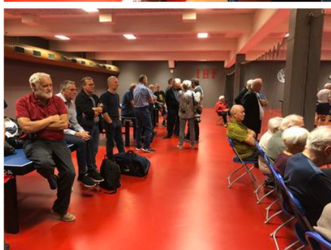
--- der betragter spillet.