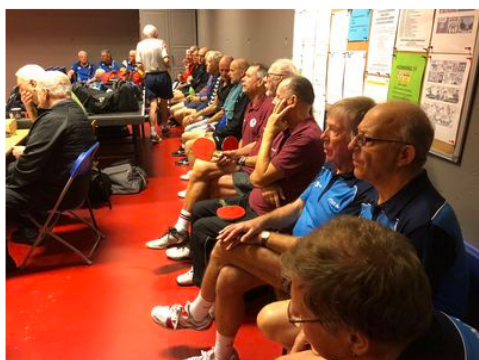
Forventningsfulde tilskuere ---

Efter den obligatoriske morgenkaffe med tilbehør starter stævnet: