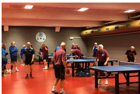
Glimt fra de spændende kampe.