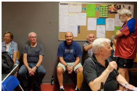
Stævnet rulles i gang -- glimt fra stolerækkerne.