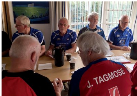
Ankomst, morgenkaffe, rundstykker og almindelig sludder.