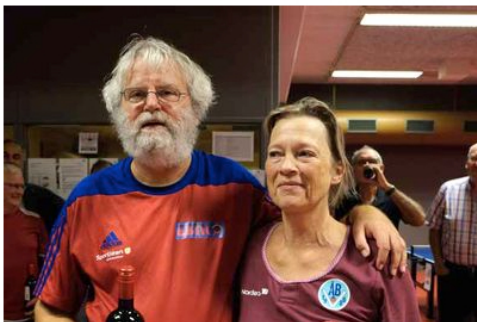
And the winner is --