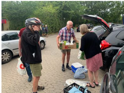
Hjemme igen på gårdspladsen.