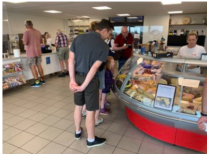
Et besøg i delikatessen.