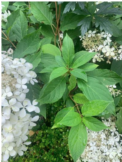
Haven i Hune.