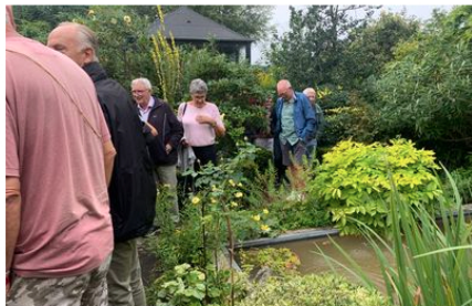
Haven i Hune.