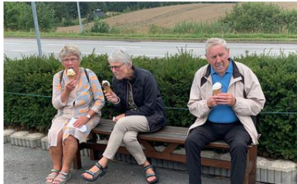
Så er der istid!