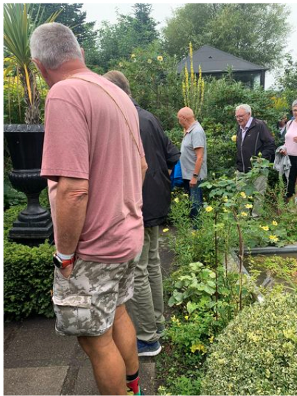
Haven i Hune.