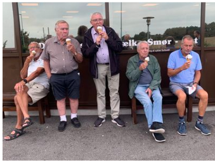
Så er der istid!