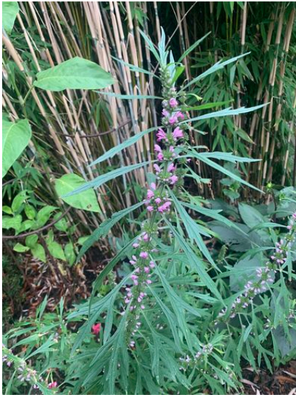
Haven i Hune.