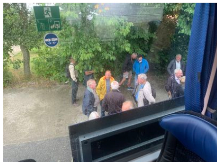
Pause på turen.