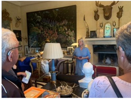
Haven i Hune.