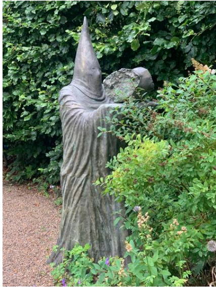
Haven i Hune.