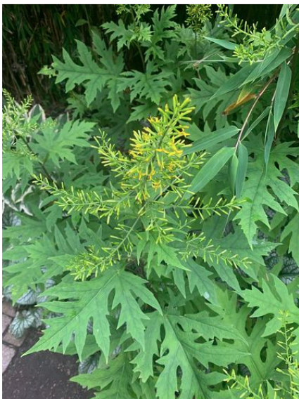
Haven i Hune.