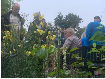
Haven i Hune.