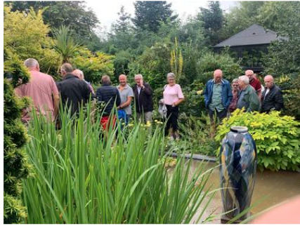
Haven i Hune.