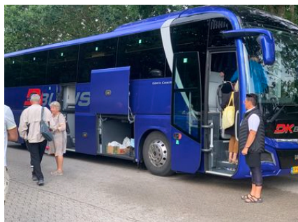
Afgang -- under overvågning af den myndige chauffør.