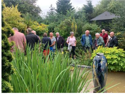
Haven i Hune.