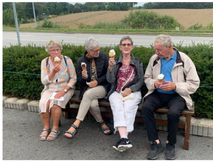
Så er der istid!