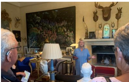
Haven i Hune.