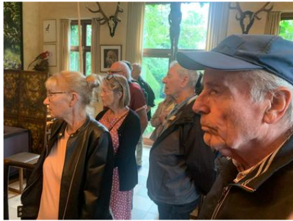
Haven i Hune.