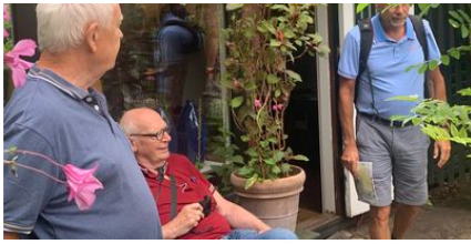
Haven i Hune.