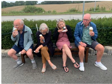
Så er der istid!