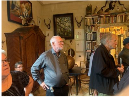
Haven i Hune.